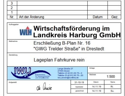
Abbildung 1: Fahrkurve rein (ohne Maßstab)